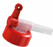
9834A Колпачок для канистры Комет (3 л, 5 л и 10 л канистры)