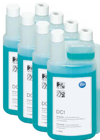
9826 (4 x 1 л в удобных канистрах с дозатором)