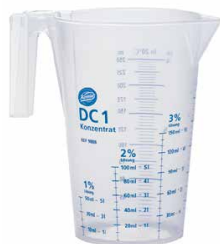
9888 DC1 Мерный кувшин