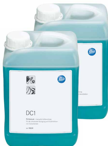
9829 (Двойная упаковка 2 x 3 л)